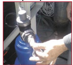
התקנת מערכת מחזור